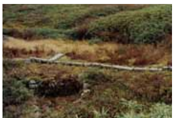
7：姥小屋跡。玄海口で一番大きかった山小屋