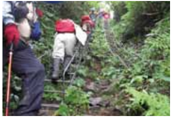
8：月光坂。難所の金月光には梯子や鎖が掛けられている

★登山上の注意 玄海古道の通行期間は、残雪量及び降雪期によりますが、7月～10月です。また、7月上旬の石跳川上流は雪渓で覆われており、スノーブリッジや増水の危険性があります。