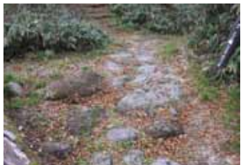
5：春木戸跡(分岐)。雪の多い春一番に掛けられる木戸