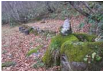
4：姥小屋跡（通称：首なし地藏）