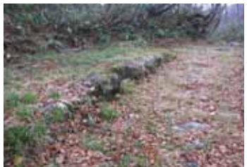
6：一の木戸跡。雪が消えると春木戸からこちらに掛け替えられる