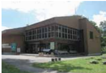
1：ネイチャーセンター（玄海）