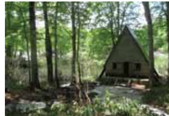
3：周海沼の側につく野鳥観察小屋